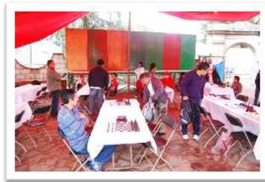
Los Ajedrecistas se preparan para la primer ronda