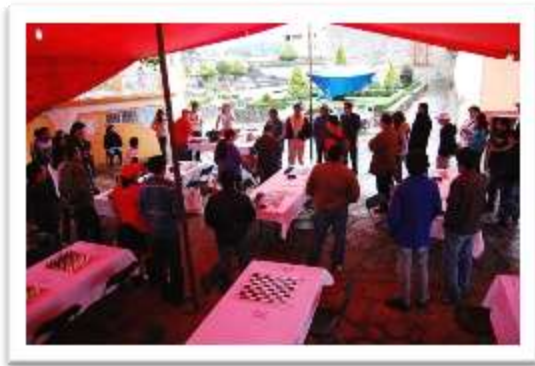
Inauguración del torneo y bienvenida por parte del comité organizador