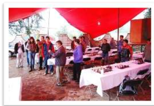
Inauguración del torneo