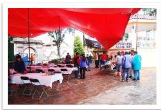
Iniciando las inscripciones y preparando el espacio de Juego

A demás de contar también con la participación de un Maestro Fide y dos Maestros Nacionales, elevando la calidad de competencia en el torneo.